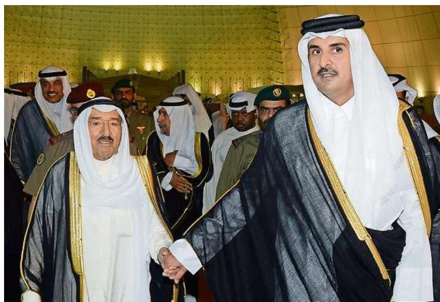
Händchenhalten mit dem Seiltänzer. Katars Scheich Al Thani (r.) mit dem Emir von Kuwait, der im Konflikt mit Saudi-Arabien als Mediator dient.

Die von der islamistischen AKP regierte Türkei hat inzwischen Hilfsschiffe mit Lebensmitteln nach Katar entsandt. Das ist ein Beispiel für die Komplexität des Konflikts, denn die Türkei ist sunnitisch und nimmt Front gegen das sunnitische Saudi-Arabien. Dies macht klar, dass man mit der Sunna-Schia-Dimension den Konflikt nicht angemessen erklären kann. Die palästinensische Hamas, die Hunderte von Millionen aus Katar erhält, hat grosse Demonstrationen zur Solidarität mit Katar gegen Saudi-Arabien orchestriert. Es klingt fast lustig, dass die islamistische Hamas-Regierung in Gaza Demonstrationen gegen ein Bündnis zwischen der PLO des palästinensischen Präsidenten Abbas, den USA und Israel organisiert. Die Hamas wittert eine Verschwörung gegen den Islam. So findet Politik im Nahen Osten statt, jenseits jeder Rationalität.